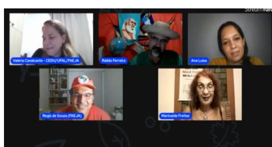
Café com Paulo Freire: A formação do/a educador/a da Educação de Jov...