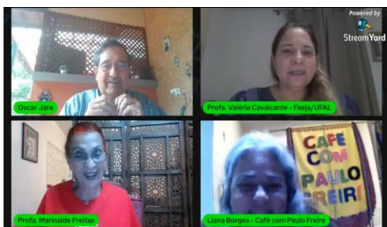
Abertura do III Ciclo de Palestras do Grupo Multieja - Paulo Freire - 100 a...