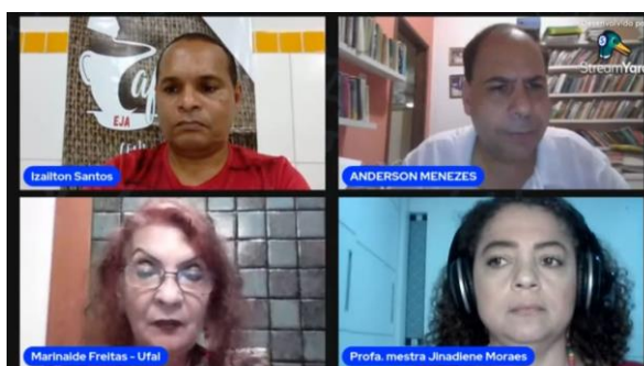
I CAFÉ DUPLO COM PAULO FREIRE