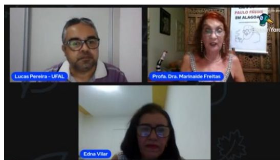
VII Café com Paulo Freire em Alagoas