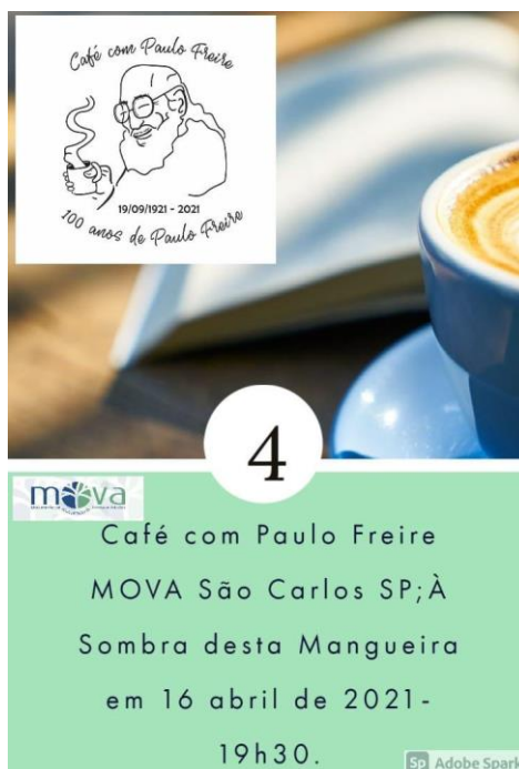
Figura 4: 4º Café com Paulo Freire MOVA-São Carlos/SP

Na sequência dos encontros no Café com Paulo Freire, sempre mensal e no mesmo horário da noite, o livro base para o mês de maio, em 2021, foi Pedagogia da esperança , de Paulo Freire. A tertúlia literária dialógica proporcionou a discussão até a página 40 do livro, deixando o restante para o próximo encontro. No registro, destacamos as dificuldades dos educadores(as) e educandos(as) quanto aos encontros remotos que, além de distanciarem uns dos outros, também provocaram muitos desequilíbrios na rotina das pessoas.