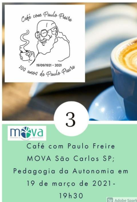
Figura 3: 3º Café com Paulo Freire MOVA-São Carlos/SP

No terceiro encontro, em 16 de abril de 2021, às 19h30, as reflexões tertúlias literárias dialógicas deram-se em torno da obra À Sombra desta mangueira , de Paulo Freire. Muitos educadores e educadoras participaram das marcações de texto e leituras, colocando luz às questões da solidão humana e das religiões como formas de opressão, do estar em sociedade como seres políticos, da importância do educar como ato político, das semelhanças e das diferenças de cada um/uma no modo de pensar, e da fragilidade entre oprimido e opressor quando, em família, por exemplo, pais/mães deixam de serem opressores para serem oprimidos pelos próprios filhos. Para encerrar a tertúlia dialógica, também foi comentado que a pedagogia libertadora de Paulo Freire busca a transformação não só do educando, mas das educadoras e da comunidade onde vive.