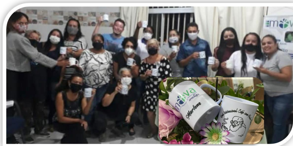
Figura 5 - 5º Café com Paulo Freire na Tertúlia Literária Dialógica, com a entrega das canecas

Os integrantes fizeram a leitura reflexiva e depois comemoraram a aquisição da caneca ecológica com a logo do Café com Paulo Freire. Um marco para o MOVA-São Carlos.